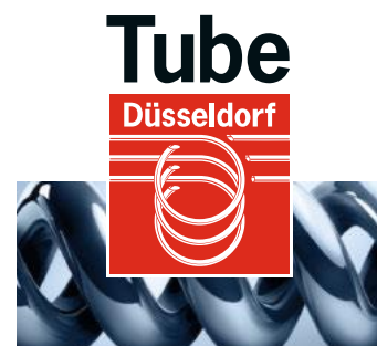
International Tube and Pipe Trade Fair Internationale Rohr-Fachmesse

30 March - 03 April 2020 www.wire.de | www.tube.de