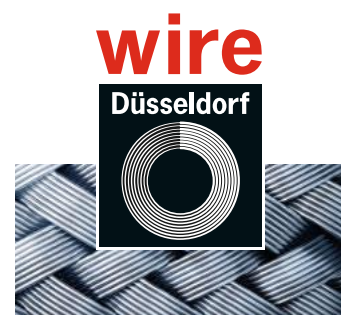
International Wire and Cable Trade Fair Internationale Fachmesse Draht und Kabel

Maschinen und Anlagen zur Rohrherstellung, Rohrbearbeitung und Rohrverarbeitung sowie Rohmaterialien, Rohre und Zubehör, Gebrauchtmachines, Werkzeuge zur Verfahrenstechnik, Hilfsmittel, Mess-, Steuer-, Regel- und Prüftechnik gehören zum umfangreichen Angebot. Der Handel mit Rohren, Pipelines und der Bereich der OCTG-Technologie sowie Profile, Maschinen und Plastic Tubes ergänzen das Angebot.